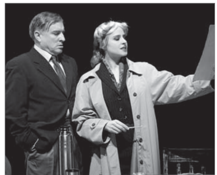
Фрагмент вистави «Малюнок Пікассо»

Виставою «Нахлібник» Національного академічного театру російської драми ім. Лесі Українки (м. Київ) завершився фестивальний тиждень. У відомій п'єсі Івана Тургенева мова йде про бідного дворянина Василя Кузовкіна, який, втрапивши все, багато років живе «на хлібах» у сусідів Коріних, виконуючи в них роль блазня. Автор порушує проблему наявності можновладців, сильних, багатих, які «мають право» і користуються цим «правом», знущаючи над бідними, слабкими та беззахисними.