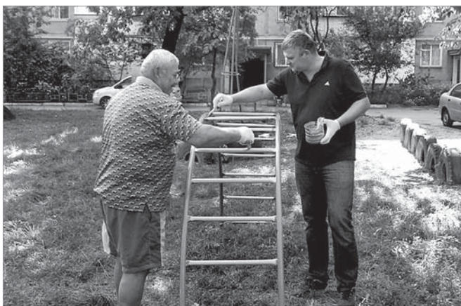
Під час суботника в районі «Дніпровський»