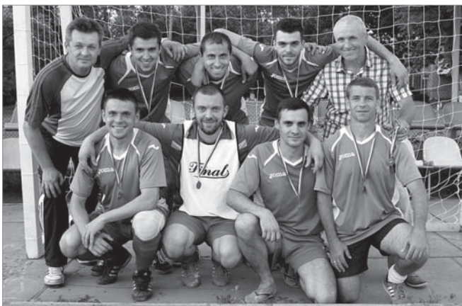
Збірна «Азоту» з А.Лукашенком (зліва) та І.Челомб'їтком

Збірна команда з міні-футболу ПАТ «АЗОТ» продовжує активно брати участь у міських та обласних змаганнях різного рівня, демонструючи відмінну гру та виборюючи призові місця.