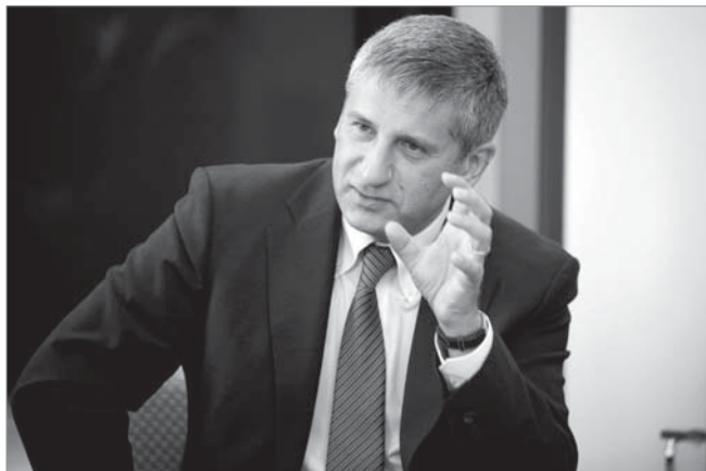
Директор АМУ Міхаель Шпінделеггер

Також директор АМУ зазначив, що під керівництвом видатних експертів і політиків з усієї Європи протягом 200 днів буде створено чіткий комплексний план модернізації України. Окрім того, Міхаель Шпінделеггер запевнив, що в агентстві використовуватимуть не лише об'єднані знання видатних експертів і досвідчених політиків з ЄС,