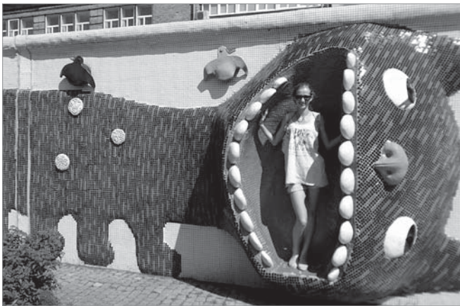
У пащі стононогого кота

Пейзажна алея – фантастично гарне місце в центрі Києва. Але воно не просто гарне, а ще має й цікаву історію. Ця місцевість сьогодні перебуває під охороною ЮНЕСКО і входить до заповідника «Стародавній Київ». Розташована вона на місці давніх валів, які служили захистом для Києва. На цій лінії оборонних споруд, що датується X–XIII століттям, у 1980 році і була закладена Пейзажна алея. Архітектором проекту виступив Авраам Мілецький.