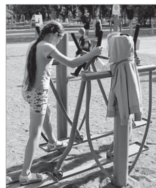
На спортивному майданчику

Значна увага приділяється незахищеним категоріям населення: людям з обмеженими фізичними можливостями, дітям, ветеранам, переселенцям з Донецька і Луганська. Минулого року було проведено акції зі збору коштів для онкохворих дітей, близько 100 малозабезпечених родин мікрорайону «Дніпровський» отримали продовольчі набори, більше 30 черкащанам надано матеріальну допомогу на лікування і реабілітацію.