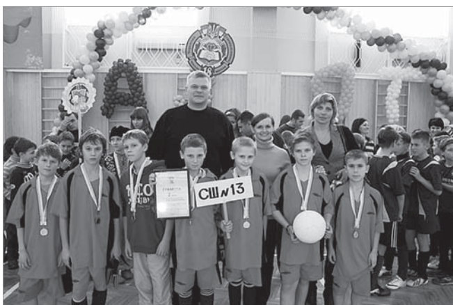
З командою школи №13 після змагань на Кубок «Азоту»

— Системна робота з вирішення проблемних для черкащан питань почалася під час передвиборної кампанії і продовжується до сьогодні. Ми знаходимо необхідні ресурси