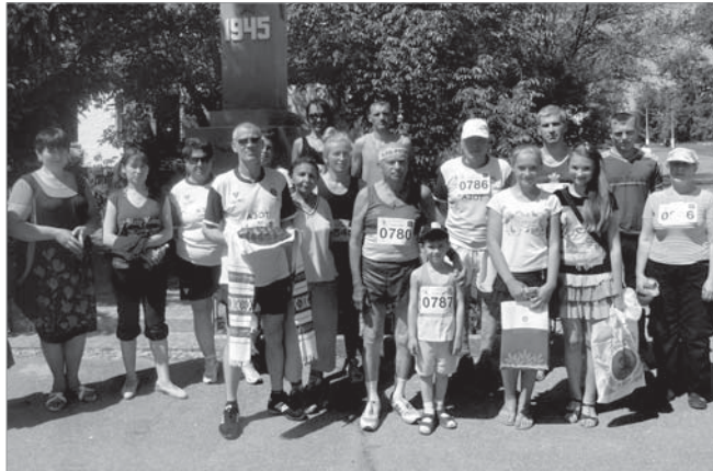
Спортсмени КЛБ «Ритм» на фініші пробігу до Дня хіміка