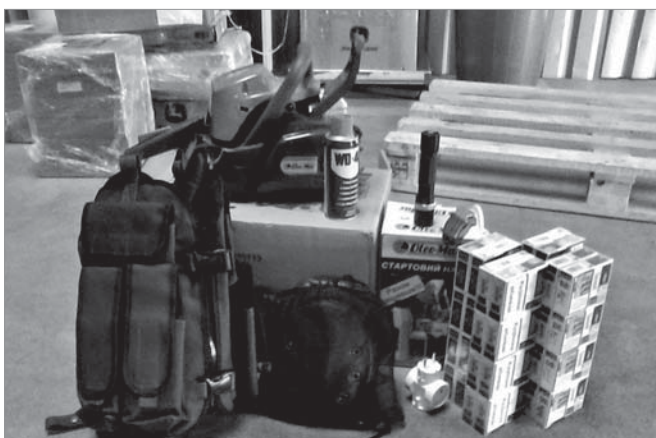
Гуманітарна допомога для українських захисників

Працівники Черкаського «Азоту» регулярно надсилають гуманітарну допомогу українським військовим, які нині перебувають на Сході. Силами виробників та ініціативної групи підприємства «Україна понад усе» станом на кінець травня зібрано вже 412 тис. грн., з яких протягом року на цільове використання було спрямовано більше 365 тис. грн.