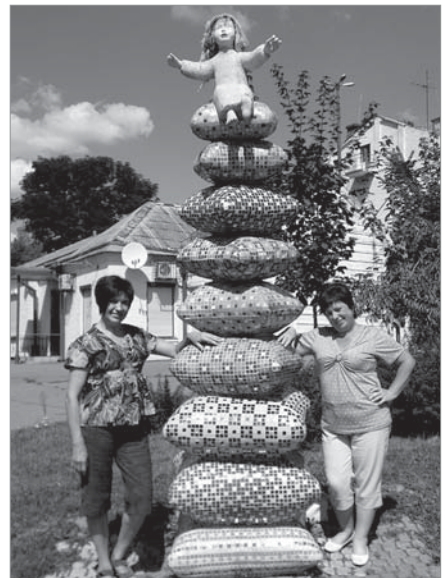
Біла скульптури «Принцеса на горошині»