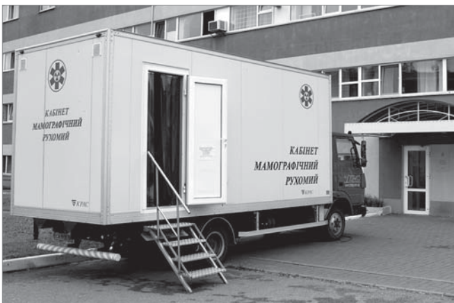
Мамографічні обстеження на «Азоті» проводять 3-й рік поспіль

Черкаський «Азот», що входить до холдингу OSTCHEM (об'єднує підприємства азотної хімії Group DF), спільно з Черкаським обласним онкодиспансером продовжують реалізацію програми боротьби з раком молочної залози. З 25 травня розпочалося обстеження жінок-виробничниць на пересувному мамографі.