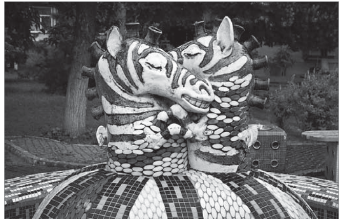
Фонтан закоханих зебр

Крім незвичного світу фауни, тут можна побачити ще й інші цікаві роботи відомих київських авторів: янголятка на горах з подушок, сир для мишки, гойдалка-черепашка, принцеса на горошині, різноманітні фонтани та багато інших цікавинок. Деякі скульптури вкриті різнокольоровою мозаїкою і це ще більше приваблює дітяків, які люблять все яскраве й радісне. І на цьому дива Пейзажної алеї, які варто побачити, не закінчуються.