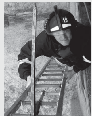
Особовий склад 1 ДПРЗ показав задовільні знання та належні результати з фізичної підготовки