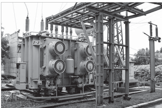
Новий трансформатор Т-2 успішно ввели в дію в кінці травня

На Черкаському «Азоті», що входить до холдингової компанії OSTCHEM (об'єднує підприємства азотної хімії Group DF), з серпня 2014 року проводиться реконструкція головної понижуючої підстанції 110/6 кВ №02. Загальний обсяг інвестицій, спрямованих на реалізацію цього проекту, складе близько 40 млн. гривень.