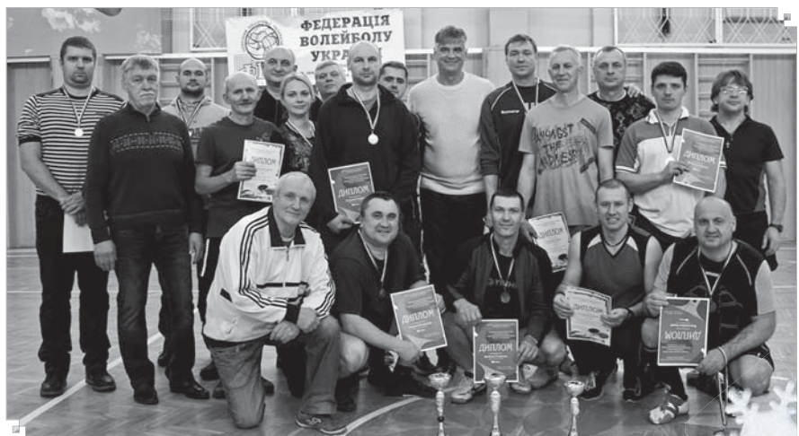
На фото переможці, призери та оргкомітет змагань з настільного тенісу