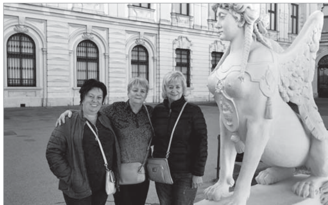
У парковому комплексі Бельведер

Відень полонить з першого візиту, з першого погляду, коли тільки сходиш трапом літака і потрапляєш у віденський простір. Це місто, яке не терпить поспіху. Воно знає, як важливо відчувати момент, бути «тут і тепер», не пробігати повз, а вміти вчасно зупинитись, побачити, почути, відчувати. А для того, щоб вхопити ритм міста, варто, насамперед, випити чашечку віденської кави та по смакувати неперевершеним штруделем. Адже без цих двох атрибутів Відень просто неможливо увіяти. Що ми й зробили у затишному кафе «Аїда», що поблизу національного символу Австрії – Собору Святого Стефана. А перша наша фотосесія відбулася на дивовижній парковій території замку Бельведер, з балкону якого було проголошено австрійську республіку. Тут також розташована мистецька галерея, де зберіга-